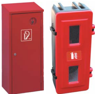
Plåtskåp med nyckellås

Ett komplett program varsel- och utrymningskyltar. Begär separat prospekt och prislista.